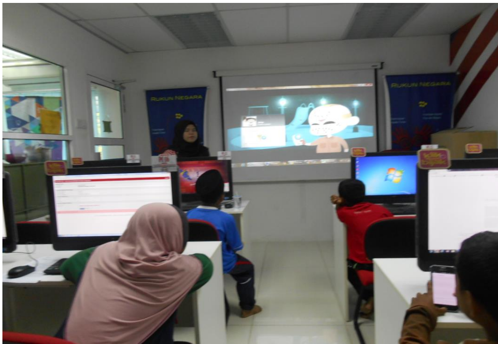
PETUGAS SEDANG MEMBERI TAKLIMAT MENGENAI KLIK DENGAN BIJAK