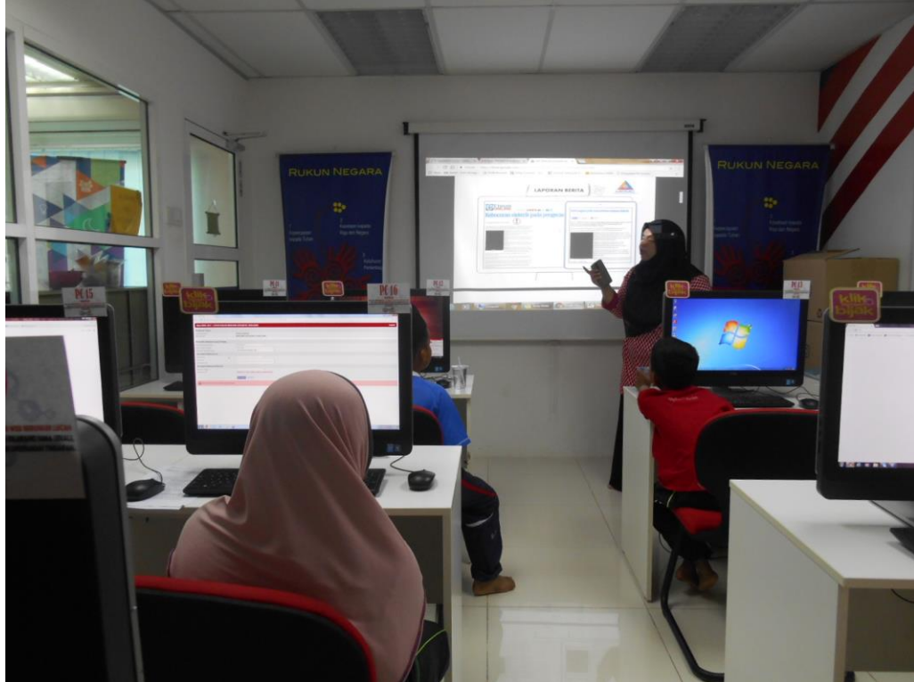
PELAJAR SEDANG MENDENGAR TAKLIMAT KENAPA PENTINGNYA UNTUK MEMERIKSA LABEL PADA PERALATAN KOMUNIKASI