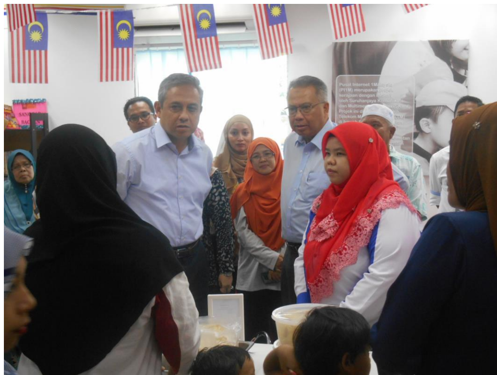
TEMURAMAH BERSAMA USAHAWAN ONLINE P11M FELDA SOEHARTO