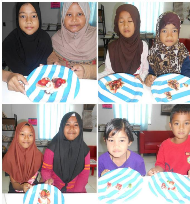
Gambar 3: Kumpulan peserta bersama hasil kreativiti yang telah siap disediakan