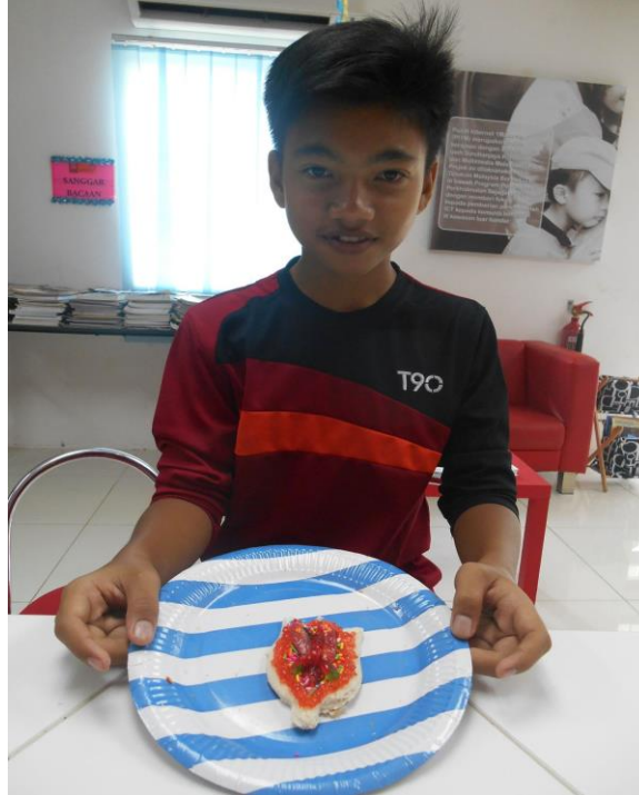
Gambar 2: Salah seorang peserta bersama hasil kreativitiya.