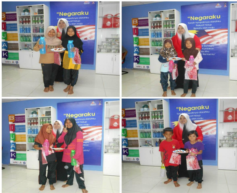
Gambar 5: Peserta bersama hadiah yang dimenangi.