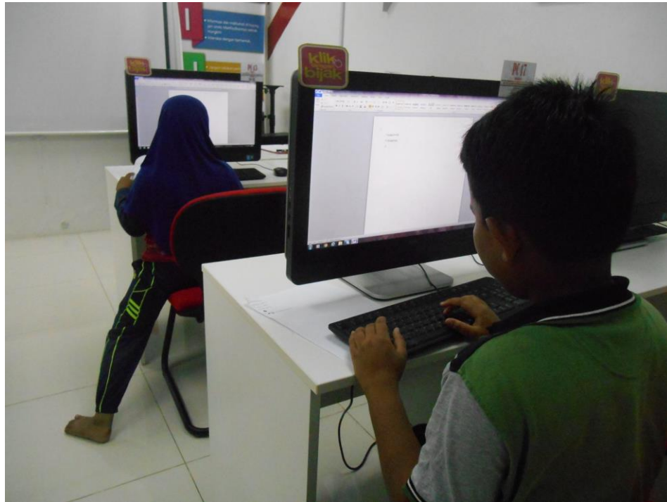
Gambar 4: Peserta sedang menaip khasiat makanan yang disediakan